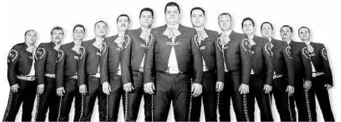
Imagen promocional del Mariachi Vargas de Tecalitlán.