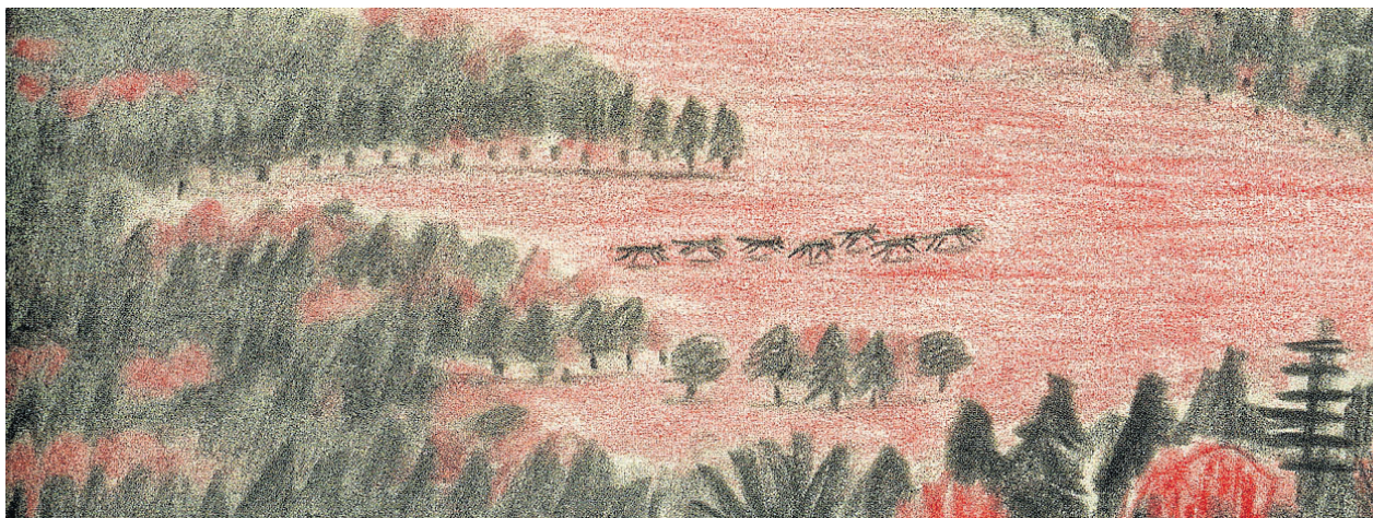
Una de las imágenes más sugerentes de William Grill, autor de 'El viaje de Shackleton': los lobos salen al claro del bosque. ¿Quién observa al acecho? WILLIAM GRILL

Hay un glosario que aclara ciertos conceptos naturales