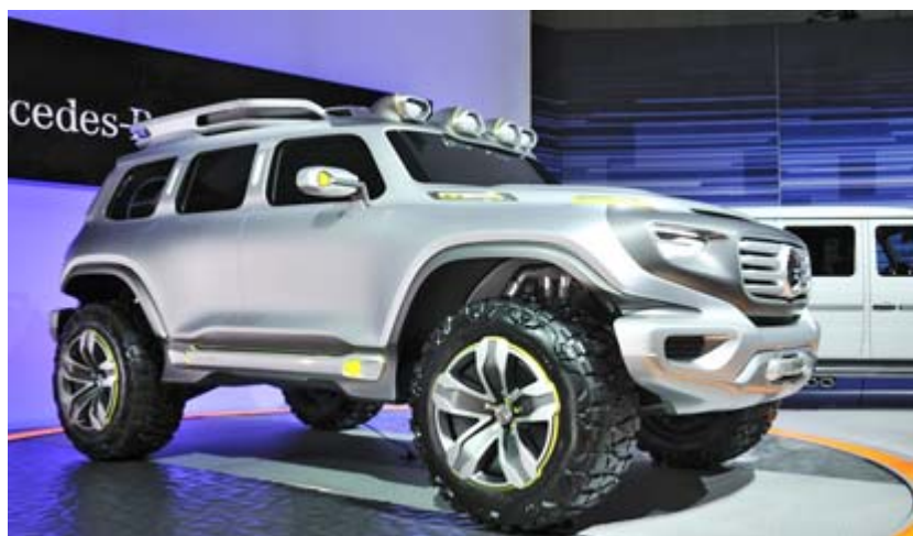
Presentación del Mercedes Ener-G-Force en el Salón de Los Ángeles 2012.