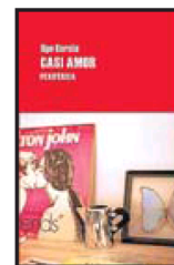
Ugo Cornia CASI AMOR Periférica, Cáceres, 2012 171 páginas

La publicación de Fábulas del sentimiento coincide con el 400 aniversario de las Novelas ejemplares de Cervantes, y está claro que el escritor leonés, que siempre se ha movido «en la herencia cervantina», ha querido rendir «un homenaje explícito» al autor del Quijote.