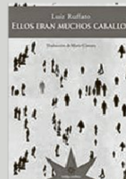
Ellos eran muchos caballos

El brasileño Luiz Ruffato (1961), apenas conocido en España y muy apreciado en el ámbito lusófono, fue periodista antes que literato. Aquellos primeros compases lo marcaron con un compromiso social que, huyendo de la denuncia panfletaria, recurre a un amplísimo abanico de técnicas para alcanzar sus fines. Ellos eran muchos caballos (2001), narración multiaureada y capital en la obra de Ruffato, aborda un día en la megalópolis de São Paulo, conjunto humano regido por la diversidad y la aparente infinitud. Para abarcarlo, Ruffato hace de la palabra la protagonista de la narración. Palabras de marginales, de traficantes, de buscavidas, de millonarios, de profesionales honrados o corruptos, de políticos, de pesimistas y optimistas componen un caleidoscopio social no apto para lectores de historias canónicas. Aquí no hay una trama, hay miles, algunas infinitesimales. Como hay miríadas de palabras que asaltan al lector por acumulación, entrecorrido o anulación hasta dar forma al retablo más retorcido y explícito de la comedia humana.