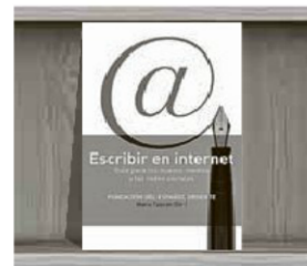
Escribir en internet

Curioso: se presenta en formato papel a la venta, pero habla de los formatos no empapelados. Dividido en dos grandes bloques (uso cotidiano y uso profesional), aspira a contarle todo lo que necesita saber en cuanto al léxico de los internautas, los secretos de Twitter y otras redes, le dará consejos y trucos para navegar frente a cualquier pantalla que use, y le añade unos anexos de uno de los cuales están to-