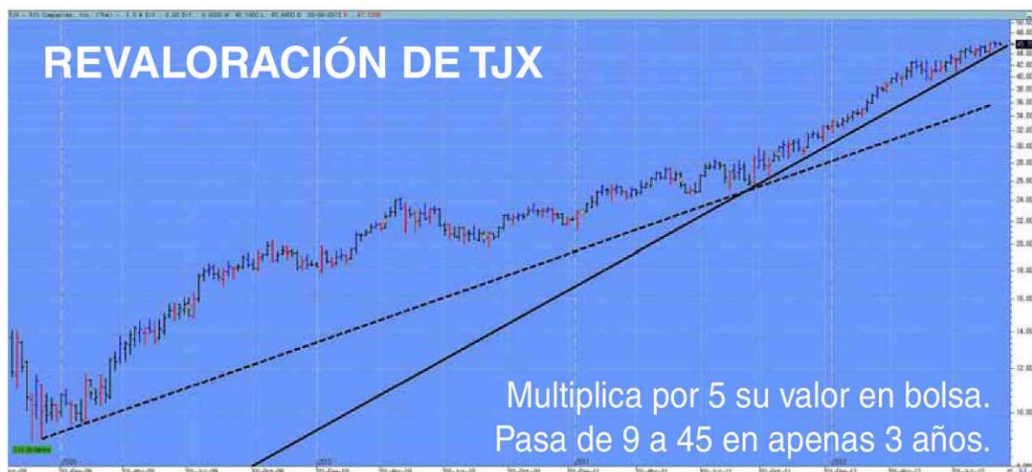
■ Gráfico que muestra cómo una acción multiplica por 5 su valor en 3 años.