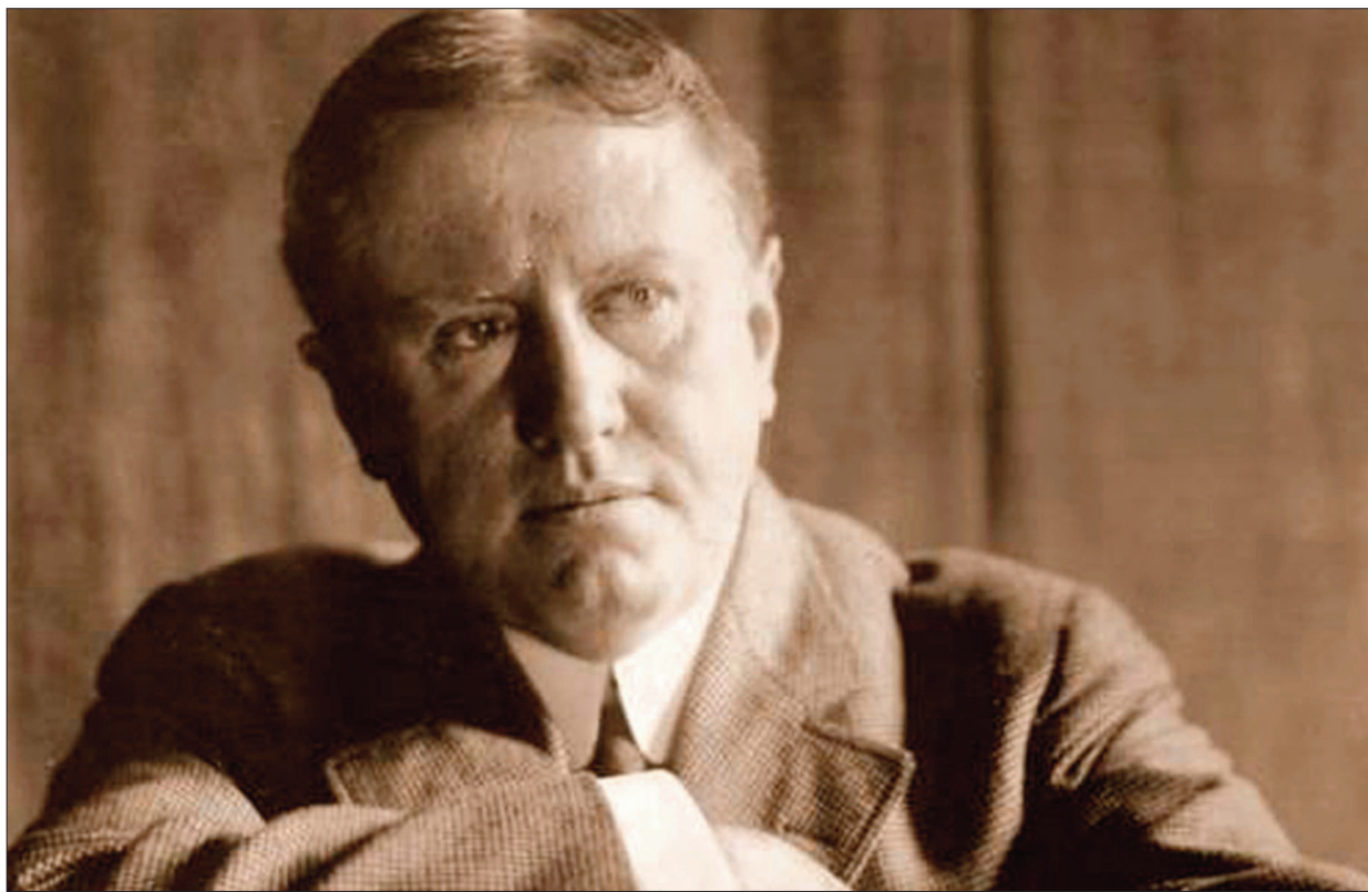
El escritor estadounidense O. Henry. ELENA PALACIOS