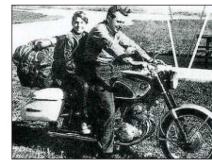
Robert M. Pirsig sobre su moto

además, bulle en su adolescencia. Cuando apareció este libro triunfaba el movimiento hippie que se rebelaba contra el sueño americano del éxito material y luchaba por la libertad sin ofrecer medidas concretas. La cultura estaba cambiando y Pirsig buscó una alternativa que fuera más allá del éxito y la libertad. Lo hizo dirigiendo su mirada hacia Aristóteles, Platón, Kant, y conciliando la filosofía occidental con la espiritualidad oriental. El resultado fue la Metafísica de la Calidad, una experiencia directa, independiente y anterior a las abstracciones intelectuales. El autor intentaba responder a las cuestiones esenciales sobre el sentido del mundo y el ser humano resumidas en una gran pregunta: ¿Dónde se encuentran el bien y la felicidad? La