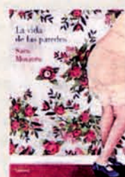
LA VIDA DE LAS PAREDES Texto e ilustración de Sara Morante. Lumen. 128 páginas. 21,90 euros.

Lenguaje visual puro y duro es el de Max. Francesc Capdevila comenzó en el cómic y ha ido concentrando su mensaje en viñetas para la prensa. Precisamente 'Cien sillones y pico' (Nórdica) es una recopilación de los 349 dibujos para serie 'Sillón de orejas' de Manuel Rodríguez Riveiro en 'El País', con el que ha mantenido un 'matrimonio profesional' seis años. La lectura, el libro, las ferias, los escritores, los lectores, protagonizan la mayor parte de sus sugerencias conceptistas.