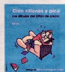
CIEN SILLONES Y PICO Max. Nórdicalibros. 130 páginas. 22,50 euros.