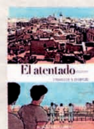
EL ATENTADO Adaptación del libro de Yasmina Khadra por L. Dauvillier. Ilustra Glen Chapron. Alianza. 160 páginas. 22 euros.