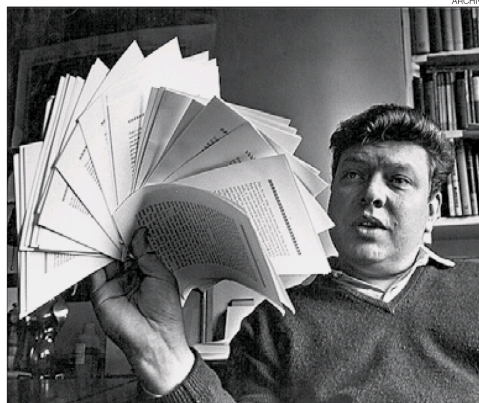
► Una imagen icónica del escritor británico B. S. Johnson.

Los desafortunados , la novela que viene en una caja (así por fortuna