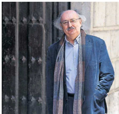
Antonio Colinas, esta semana en Valladolid.

El libro recorre los hitos de una vocación poética orientada al misterio. Pero no se confunda este misterio con los razonamientos tortuosos o la oscuridad añadida. Al contrario, se trata de un misterio claro , lavado por una lluvia como la que baña el cereal y de la que un día, ante las quejas del poeta por su mansa persistencia, dijo una campesina en huelga forzada de labores agrícolas: “Hoy te toca trabajar a Dios y a nosotros descansar”. •