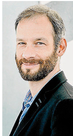
Slobodeniouk. M. Borggreve

Entre sus próximos compromisos internacionales esta temporada destacan su debut con la Sinfónica de Boston, Orquesta del Concertgebouw de Ámsterdam, Filarmónica de Rotterdam, Sinfónica de Seattle o la Sinfónica de la NHK. ALBINO MALLO