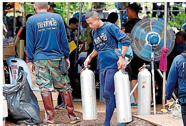
Un buzo prepara llevar algunas botellas de oxígeno.

El nivel de agua sigue descendiendo gracias a la ventana de buen tiempo, la salidas de escape naturales y los trabajos de drenaje. Sin embargo, las autoridades tailandesas apuntan que la cantidad todavía es elevada en zonas cruciales durante el camino hacia el exterior.