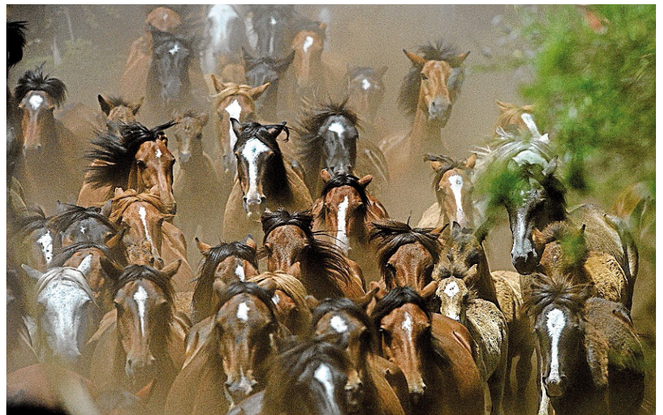
El equipo, formado por cuatro personas, estará grabando en la zona durante todo un año.

Actualmente, el rodaje se encuentra en fase de desenvolvimiento, grabando para ofrecer un teaser y buscando financiamiento regional y nacional antes de salir en el mercado internacional. Por lo de pronto, el proyecto fue seleccionado por el prestigioso programa Euro-