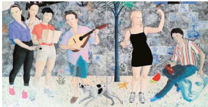
Obra de Los Bravú, representados por 6más1, galería española que viajará a PINTA