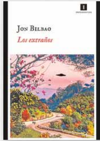
'LOS EXTRAÑOS' JON BILBAO Ed. Impedimenta