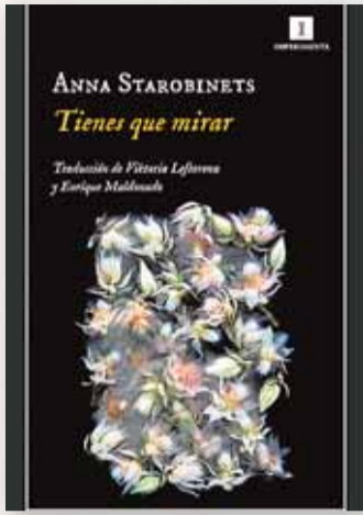
'TIENES QUE MIRAR' ANNA STAROBINETS Ed. Impedimenta