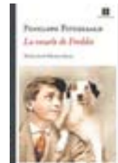
LA ESCUELA DE FREDDIE PENELOPE FITZGERALD

Libros del Asteroide publica por primera vez en castellano 'Huntington Beach', un clásico del género negro ambientado en el sur de California y una de las más destacadas obras del escritor y guionista estadounidense Kem Nunn. La mayoría de la gente que llega a Huntington Beach –la meca del surf en el sur de California– lo hace en busca de sus olas y sus fiestas interminables. Pero lo que Ike Tucker quiere es encontrar a su hermana y a los tres hombres con los que la vieron por última vez. Su pesquisa se transformará en un viaje de autodescubrimiento a través de surfers, rnoteros, punks y 'camellos'. Joven e ingenuo, Ike se irá adentrando peligrosamente en las entrañas de una ciudad amable que esconde un violento submundo del que no le será fácil escapar. R. C.