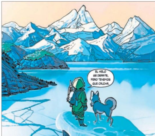
Detalle de la portada de Global .