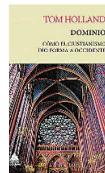
Portada de la primera edición española de «Dominio», que se publicó en 2021

las que se incluyen en los Evangelios. Alrededor de eso únicamente hay silencio. La pregunta que plantea es lógica, casi elemental: ¿cómo la cruz, un símbolo tan peyorativo en aquella sociedad, se