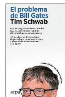
«El problema de Bill Gates» Tim Schwab ARPA 520 páginas, 24,90 euros

En este libro hay un doble camino. Uno es exterior y otro interior. El primero es el que trazan a lo largo del texto los protagonistas, y el otro, más personal, que se refiere a las mutaciones, transformaciones y evoluciones interiores de ellos mismos. La historia de una mujer responsable que un día necesita huir de todo lo que la ataba a su vida.