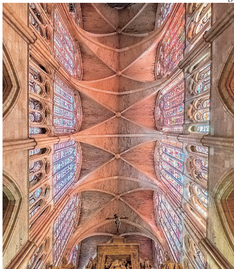
La Catedral de León, un templo gótico que invita al hombre a elevar su alma

Esta obra empieza contando dónde se crucificaba a los reos en la ciudad de Tíber y describe que ni siquiera los antiguos tenían demasiado claro el origen de este castigo, que muchos sitúan en tierras de Oriente Medio, tirando hacia lo que es el actual Irán. La realidad es que esta pena máxima era tan vejatoria, resultaba tan humillante para los romanos, que solo se conservan cuatro descripciones: