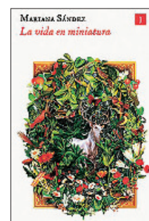
«La vida en miniatura» Mariana Sánchez IMPEDIMENTA 192 páginas, 20,95 euros

El autor, que es uno de los grandes historiadores actuales, evoca en estas páginas, tirando de su enorme erudición, la presencia que han tenido desde siempre las cartografías y los mapas a lo largo de historias, novelas, narraciones, sátiras, utopías y distopías, desde la antigüedad hasta un libro tan cercano a nosotros como es «Don Quijote de La Mancha».