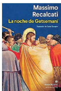
«La noche de Getsemaní» Massimo Recalcati ANAGRAMA 304 páginas, 23 euros

A veces el recorrido de la vida puede contemplarse desde una piscina. Kat decide nadar 39 largos, uno por cada año de su vida. A lo largo de ese recorrido, meditará sobre su existencia, las decisiones que la han llevado hasta ese preciso momento. Una reflexión que tendrá como objetivo tomar una decisión que será esencial para su posteriores vivencias.